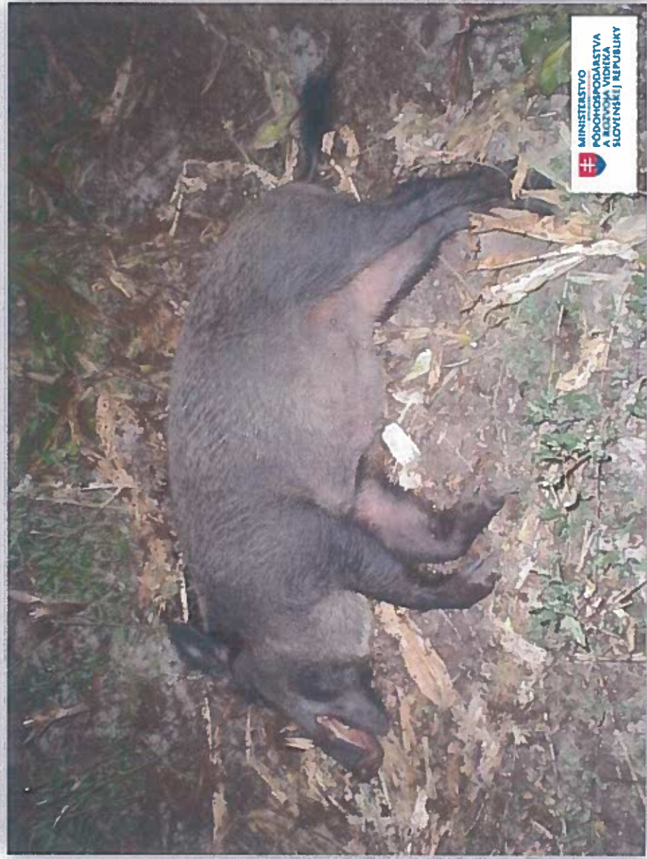
Vzor fotografie č.1