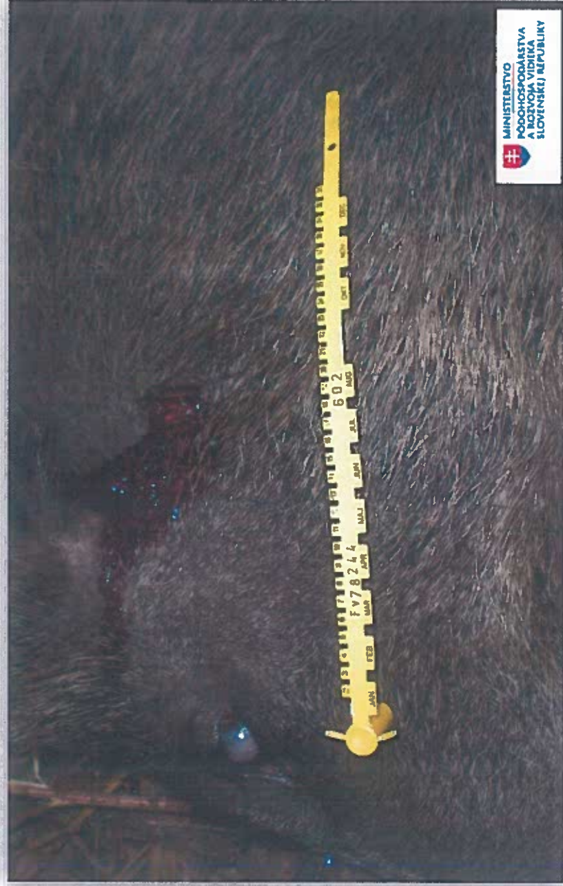
Vzor fotografie č.2