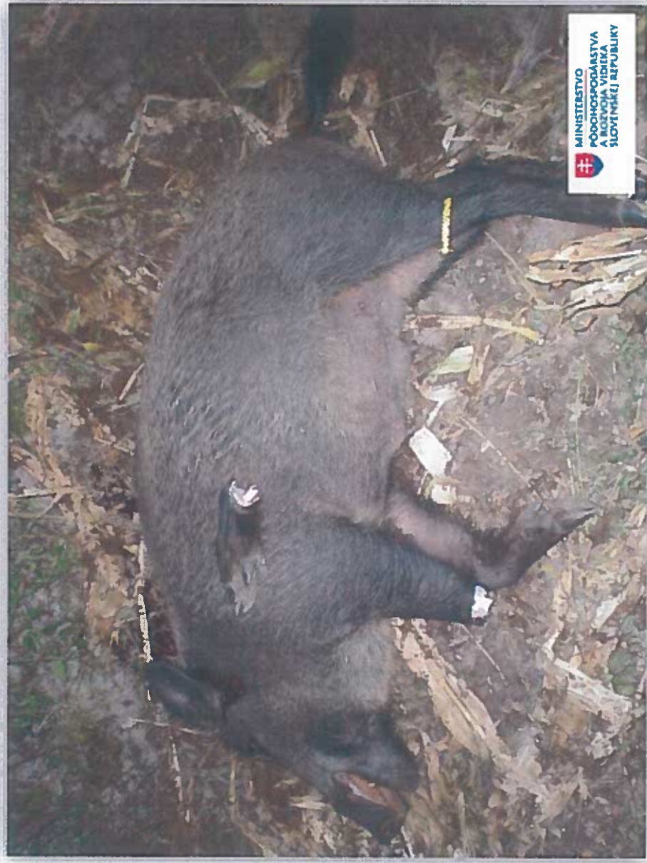
Vzor fotografie č.3